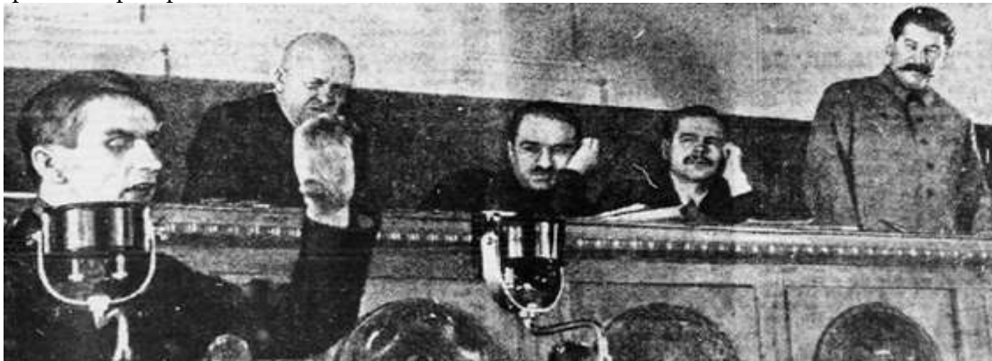
(Lysenko hovoří v Kremle v roce 1935. Na tribuně za ním soudruzi Kosior, Mikojan, Andrejev a Stalin)

Lysenkovo rozpracování akceptovala a oba vědci začali rozvíjet další plodnou spolupráci. Kvůli blízkému přátelství mezi Lysenkem a Stalinem a také proto, že jak Lysenko, tak Lepešinská byli velmi aktivní v odstraňování svých oponentů, byla teorie živé hmoty v Sovětském svazu a jeho satelitech bezvýhradně přijata. Vědecká pracoviště v SSSR i jiných lidově demokratických státech, Československo samozřejmě nevyjímaje, začala do světa hlásit, i prostřednictvím sdělovacích prostředků, pozorování přeměny buněk jednoho druhu na buňky druhu jiného. Tato pozorování postupně narostla do absurdních rozměrů, kdy, podle jednoho z fundovaných hlášení, adresovaných sovětské akademii věd, byla pozorována například přeměna kukačky v pěnkavu, čočky v hrášek anebo spontánní vyrašení větve buku na bříze. Teorie živé hmoty byla beze zbytku opuštěna teprve po Stalinově smrti.